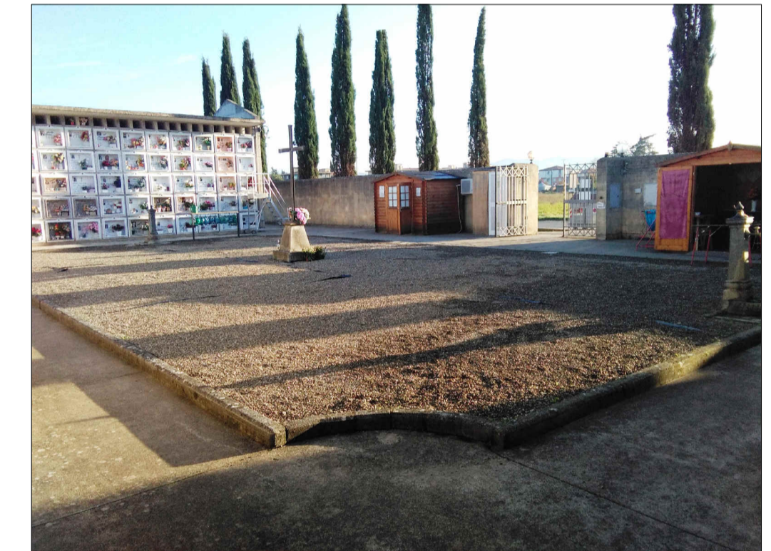
Foto dell'Atrio d'ingresso